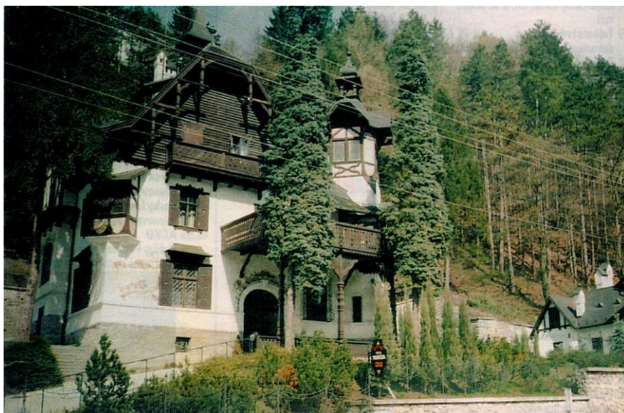
Vila Tereza sa spája s menom Laca Novomeského