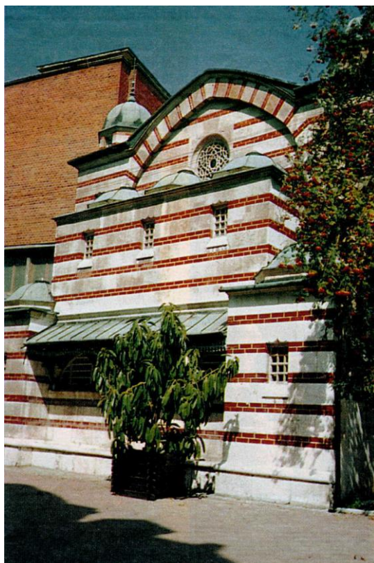
Orientálne pôsobiaci Hamman

Podľa povesti liečivé pramene v Trenčianskych Tepliciach objavil chromý a chudobný pastier, keď hľadal zatúlanú ovečku. Uvidel nenápadné jazierko, z ktorého sa šíril sírový zápach.