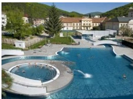
Vonkajší bazén Grand